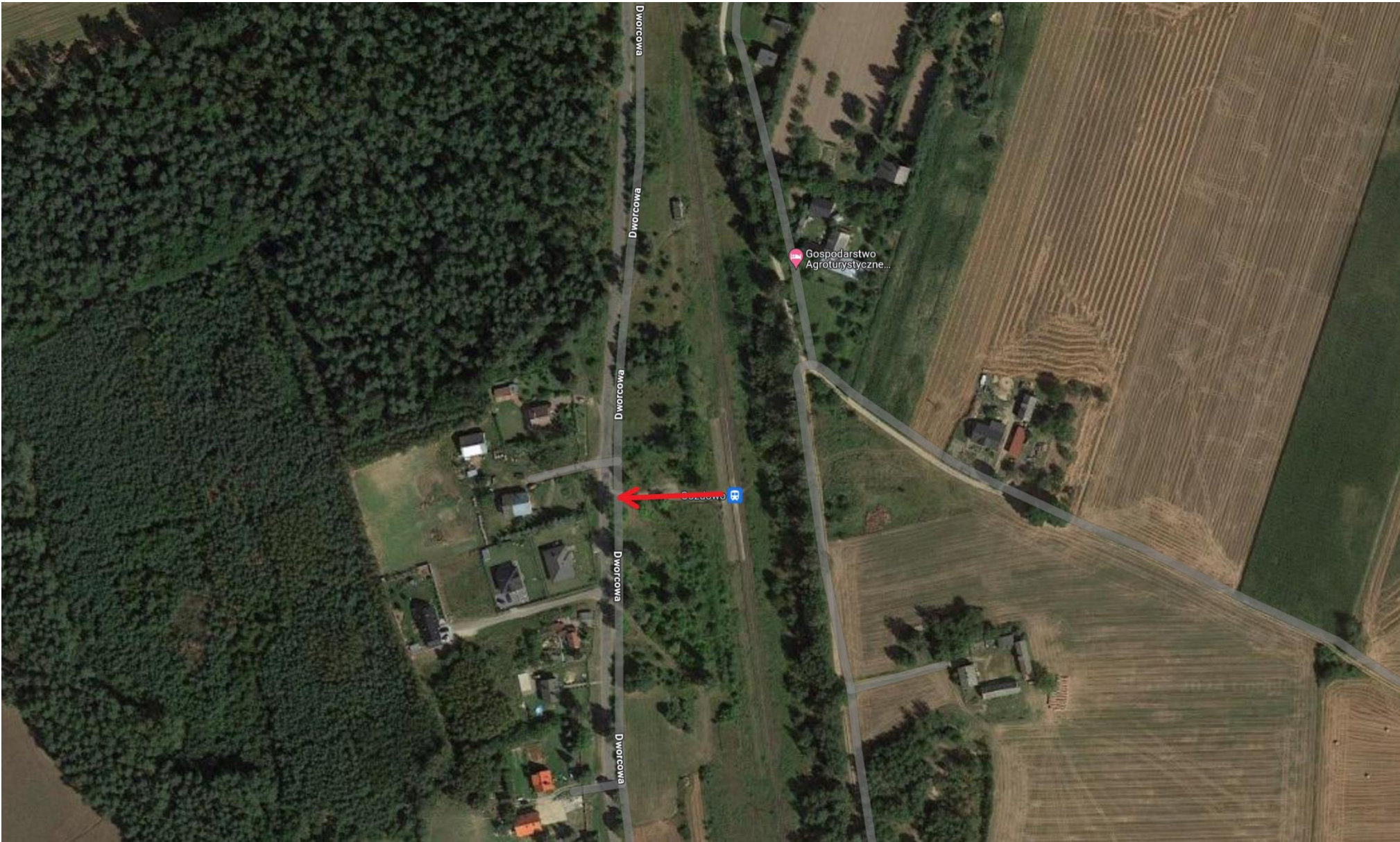
Strzałka wyznacza sugerowaną drogę przemieszczania się podróżnych do przystanków ZKA.