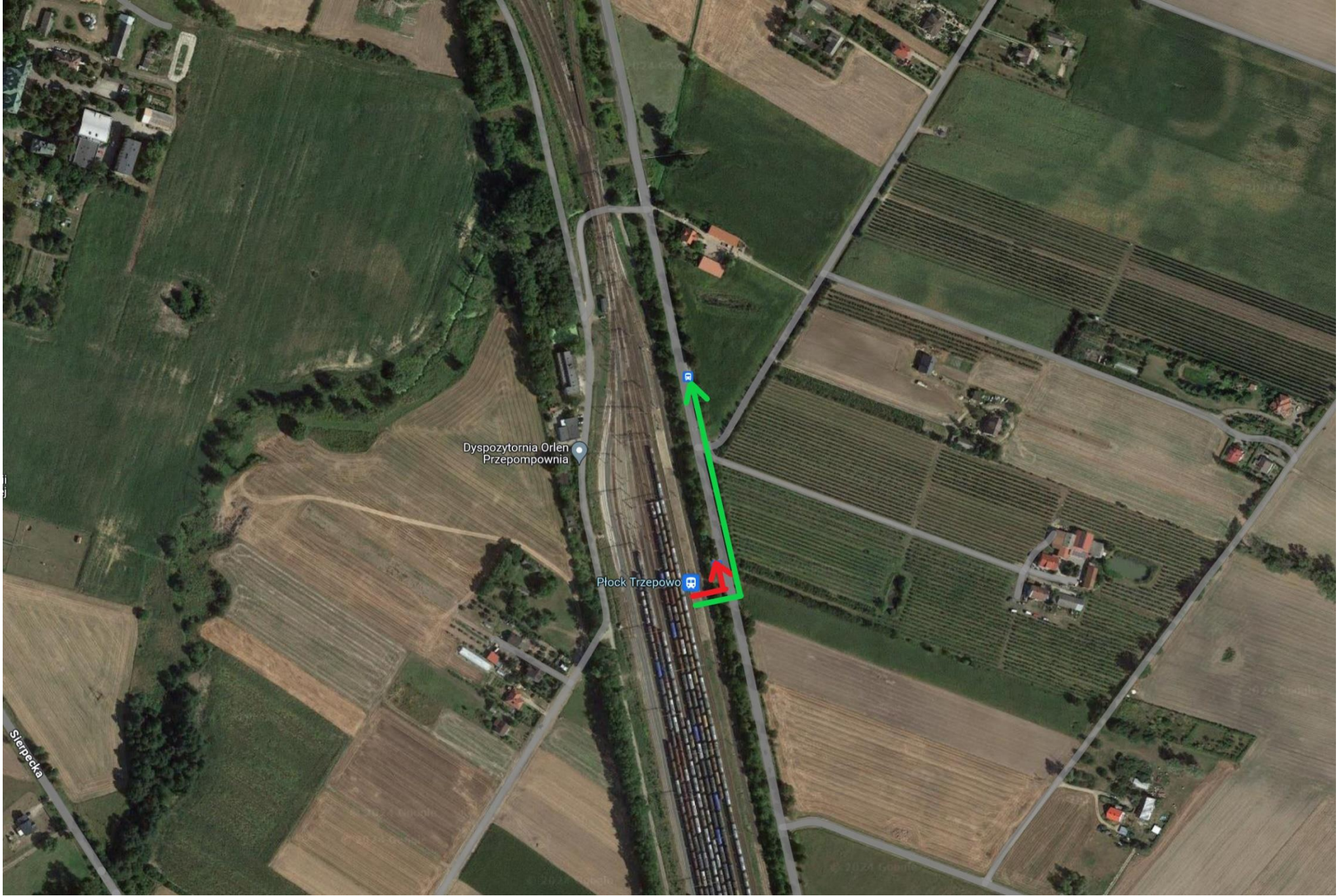
Strzałki wyznacza sugerowaną drogę przemieszczania się podróżnych do przystanków ZKA.