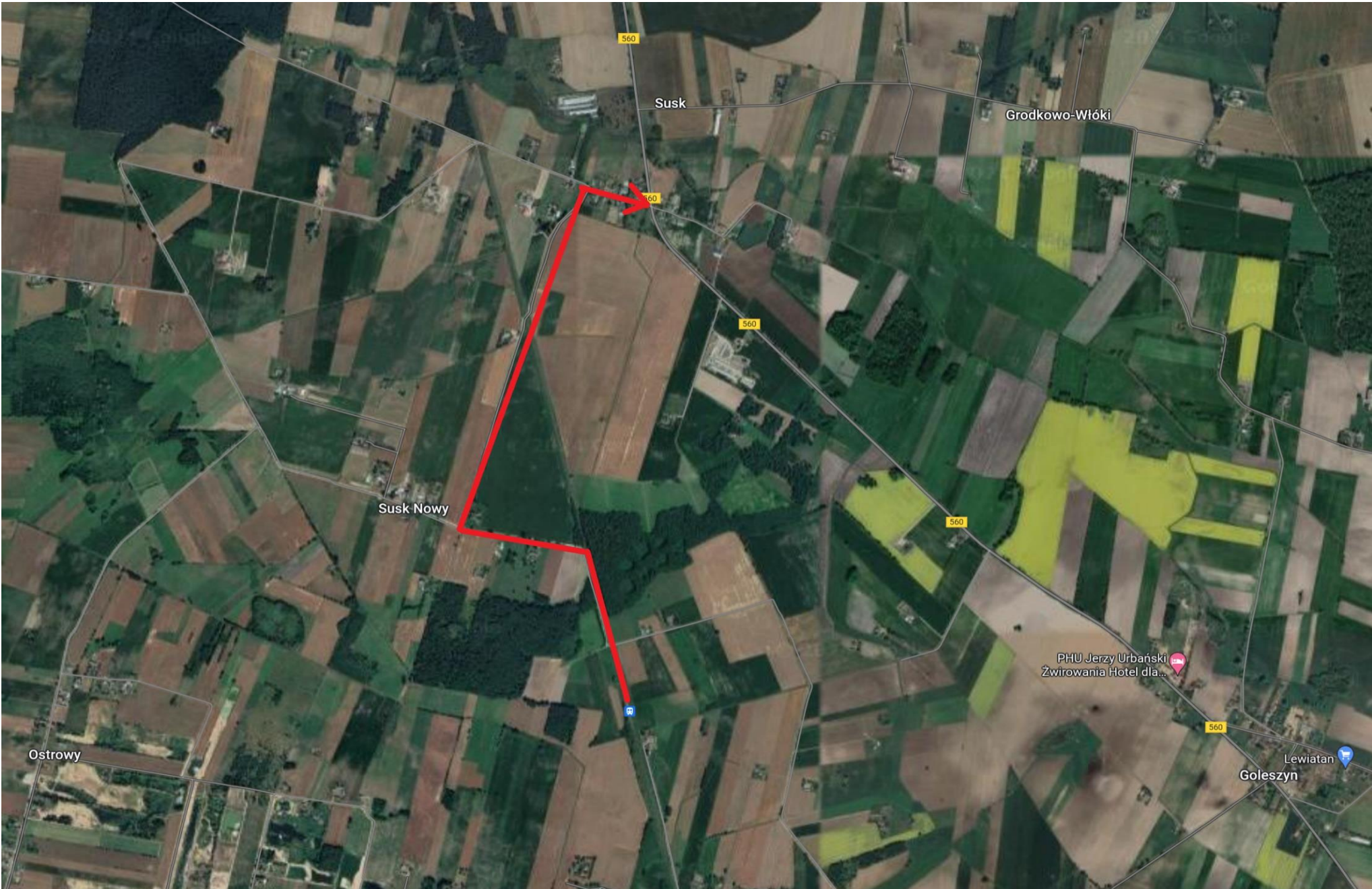
Strzałka wyznacza sugerowaną drogę przemieszczania się podróżnych do przystanków ZKA: