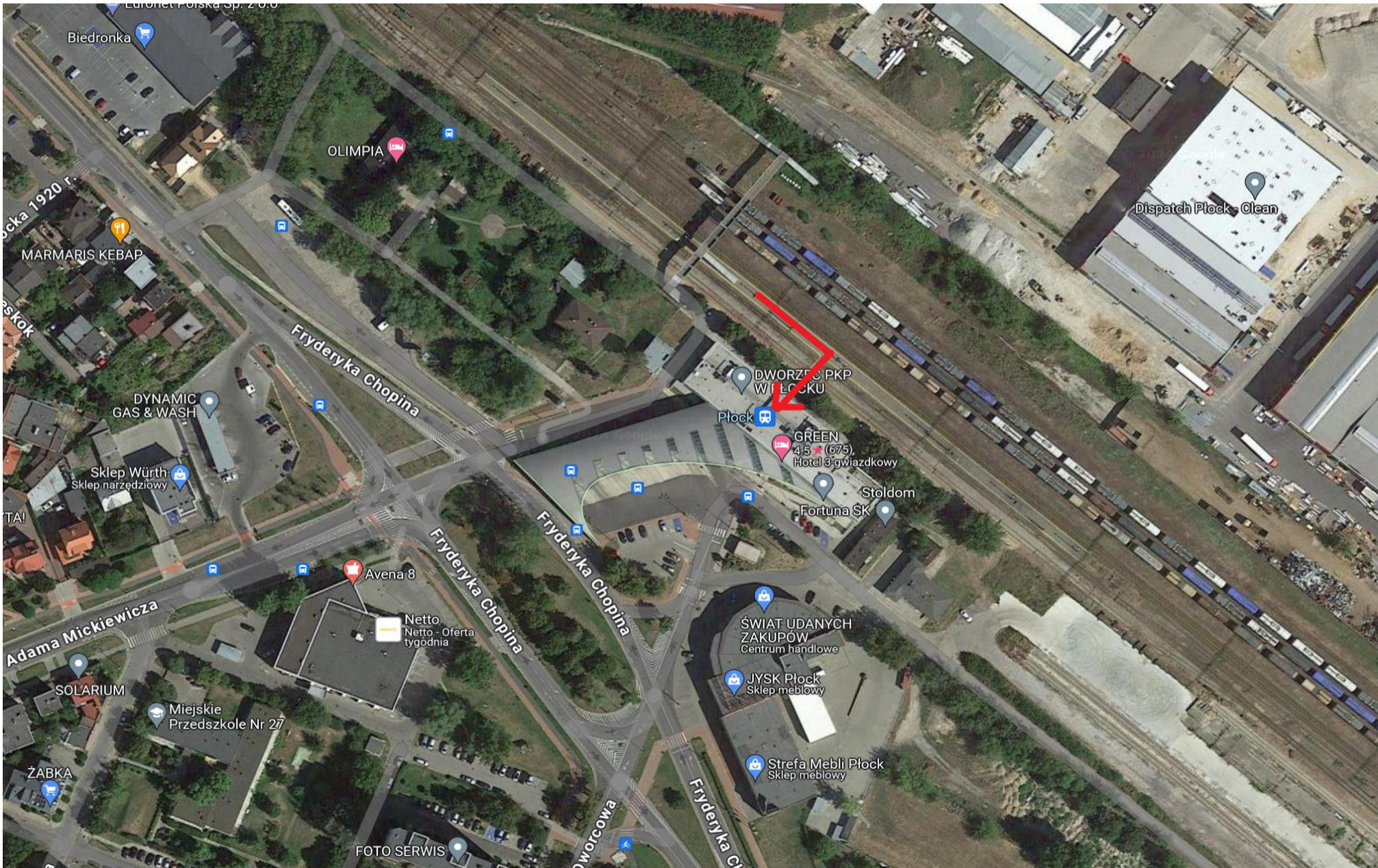
Strzałka wyznacza sugerowaną drogę przemieszczania się podróżnych do przystanku ZKA: