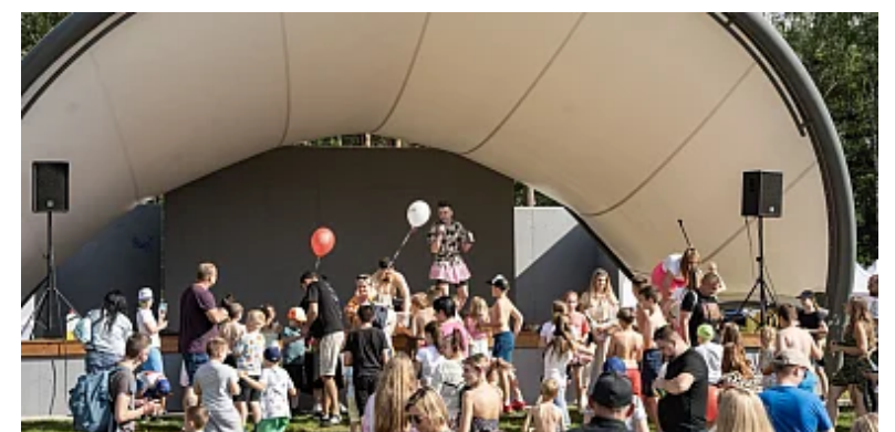
Powitanie lata w Łódzkiem!