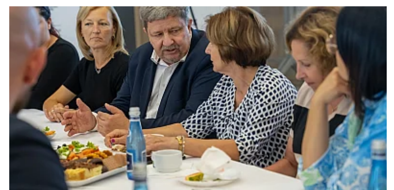
Koła Gospodyń Wiejskich dumą Łódzkiego