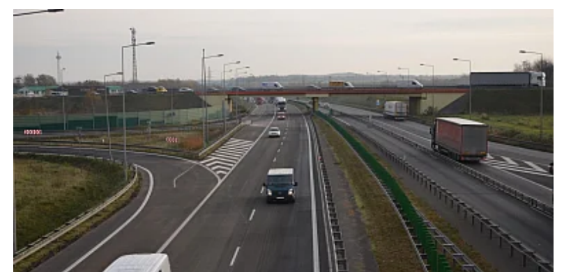
GDDKiA przygotowuje do budowy kolejne inwestycje