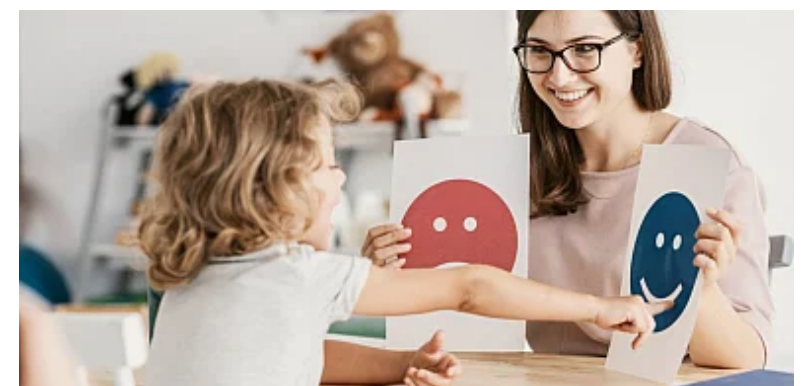
Wakacyjna korekta rozkładu jazdy pociągów