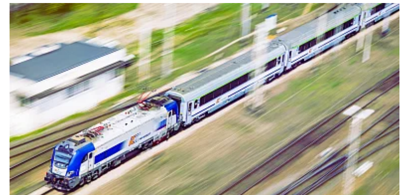
PKP Intercity: wakacyjny rozkład jazdy dla województwa łódzkiego