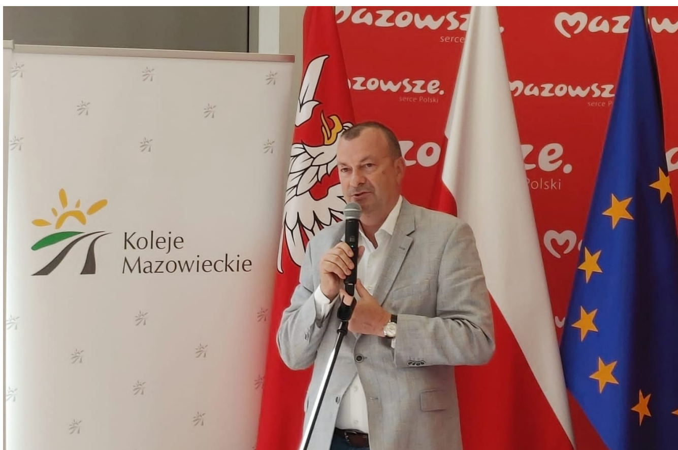
Wiesław Raboszuk, Wicemarszałek Województwa Mazowieckiego.

Koleje Mazowieckie to samorządowy przewoźnik na Mazowszu, z którego usług codziennie korzysta blisko 176 tysięcy osób. Jak podkreśla wicemarszałek Wiesław Raboszuk , dzięki ponad 242 mln zł unijnego dofinansowania spółka unowocześni swój park taborowy. - Systematycznie inwestujemy w nowe pojazdy dla Kolei Mazowieckich. W sumie zaplanowaliśmy zakup aż 75 elektrycznych zespołów trakcyjnych. Dzisiejsza umowa pozwoli na zakup 15 nowoczesnych i ekologicznych elektrycznych zespołów trakcyjnych. Nowy tabor to szansa na zwiększenie liczby połączeń i częstotliwości kursowania pociągów.