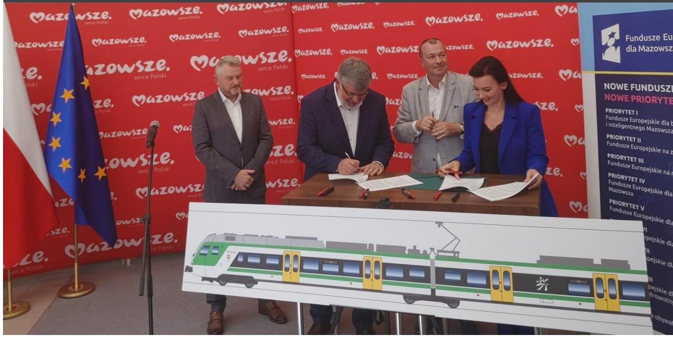
Podpisanie umowy.

15 elektrycznych zespołów trakcyjnych to nie jedyne planowane inwestycje poprawiające pasażerski transport kolejowy na Mazowszu. W ciągu najbliższych 4 lat spółka pozyska 16 nowych dwuczłonowych elektrycznych zespołów trakcyjnych. Dzięki środkom uzyskanym z Krajowego Planu Odbudowy i Zwiększenia Odporności została również podpisana umowa ramowa na zakup 50 ezt najnowszej generacji oraz 2 umowy wykonawcze na dostawę 25 sztuk pojazdów kolejowych.