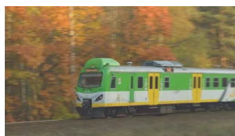
Rozkład jazdy pociągów KM edycji 2019/2020 20 listopada 2019 W "Gazeta"