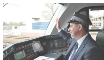
POCIĄGIEM DO ZEGRZA I RUSZA PRZEBUDOWA DK 61 19 października 2015 W "Gazeta"