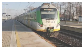
Zmiany w rozkładzie jazdy na linii nr 6 Warszawa – Małkinia od 20 stycznia 2020 r. 22 stycznia 2020 W "Gazeta"