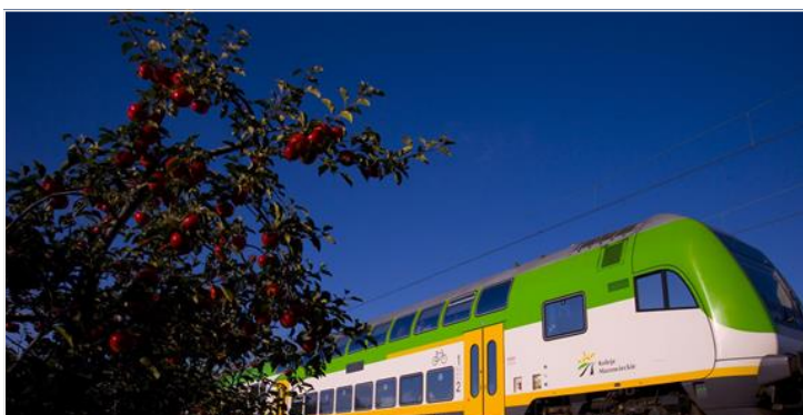
Wchodzi w życie wakacyjny rozkład jazdy KM