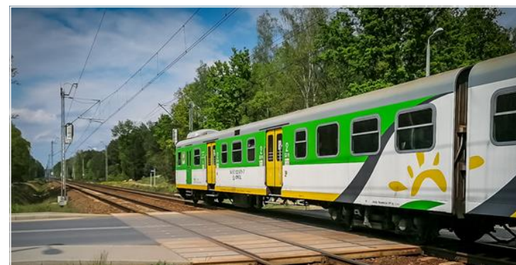
Coraz więcej pociągów