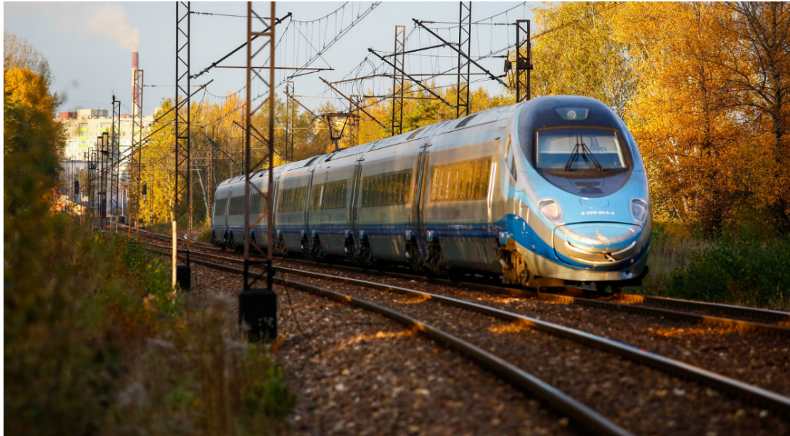
Zdj. ilustracyjne

Dodatkowe składy PKP Intercity pojawią się na najbardziej obleganych połączeniach międzymiastowych. Chodzi między innymi o trasy Warszawa-Wrocław, Kraków-Warszawa i Gdynia-Łódź.