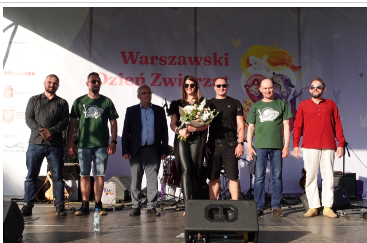
Koleje Mazowieckie aktywnie włączają się w pomoc czworonogom ze schroniska „Na Paluchu”

Spółka Koleje Mazowieckie została Przyjacielem Schroniska „Na Paluchu”. Wyróżnienie jest podziękowaniem za wsparcie i współpracę na rzecz rozwiązywania problemu bezdomności zwierząt.