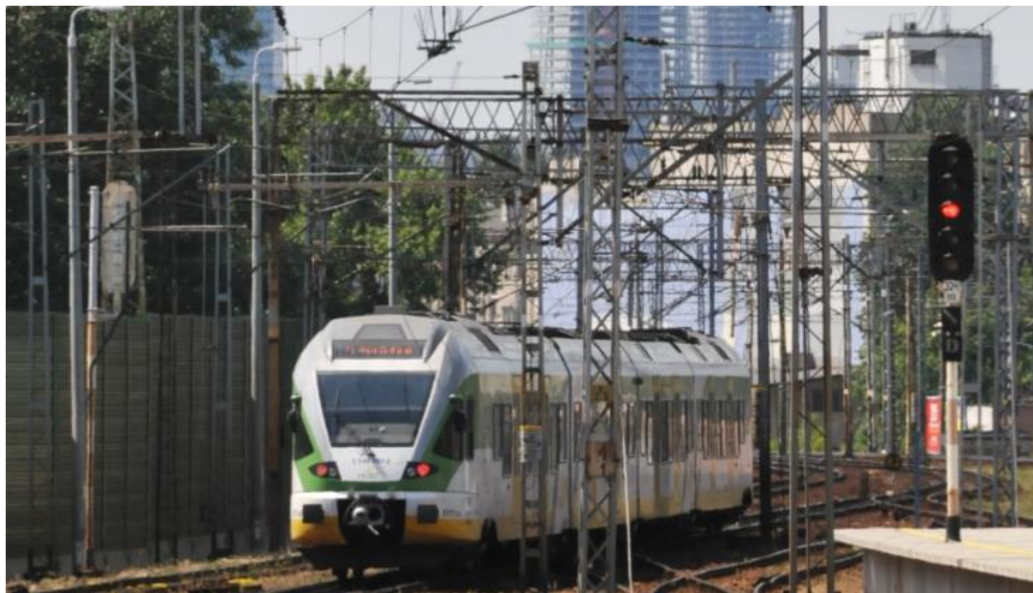
Flirt pierwszej serii należącej do Kolei Mazowieckich