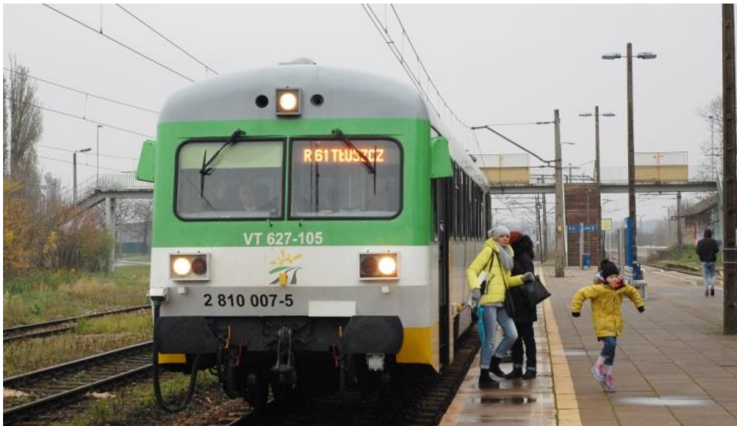
(zdjęcie ilustracyjne)

Konferencja prasowa Kolei Mazowieckich zorganizowana w związku z wprowadzeniem nowego rozkładu jazdy było okazją do zapytania Kolei Mazowieckich o współpracę z PKP PLK.