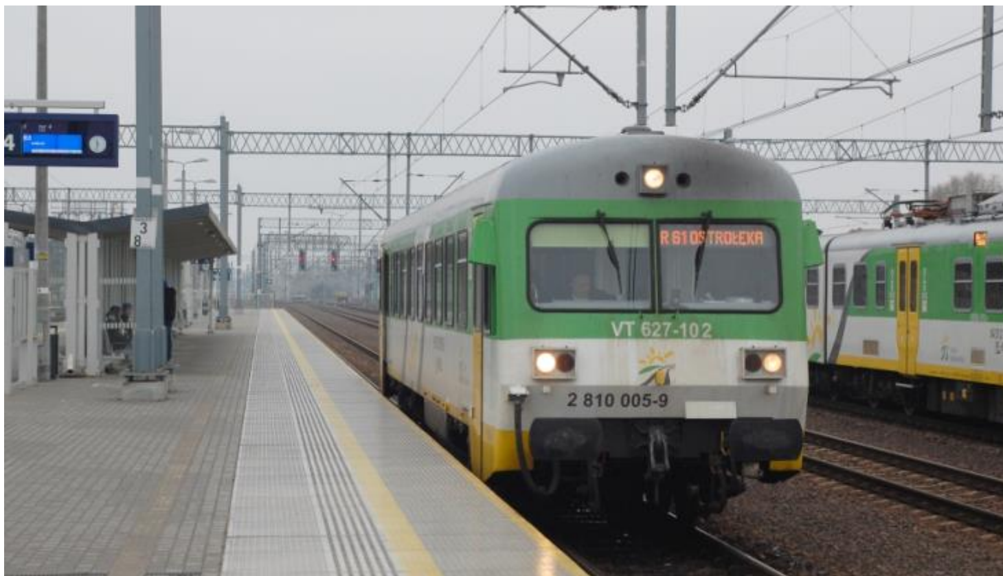
(zdjęcie ilustracyjne)

Koleje Mazowieckie, oprac. MS • 20.02.2019 • 0