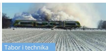
Tabor i technika