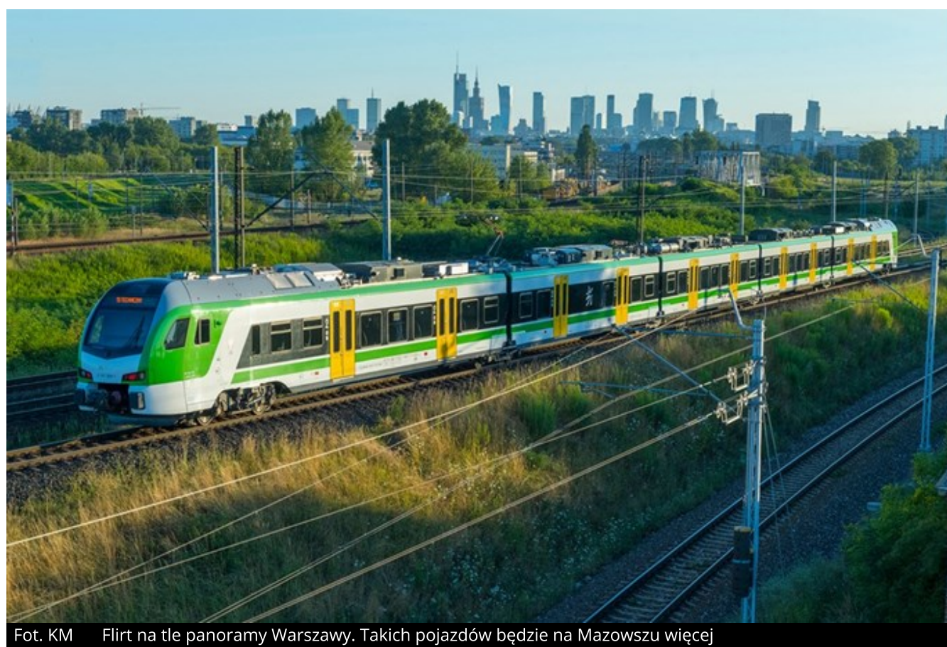
Flirt na tle panoramy Warszawy. Takich pojazdów będzie na Mazowszu więcej

Koleje Mazowieckie skorzystały z opcji na dostawę 10 pięcioczonowych ezt w ramach umowy na dostawę 15 pięcioczonowych ezt zawartej na początku lipca. Oznacza to, że umowa na dostawę 15 plus 10 ezt zostanie zrealizowana w pełnym zakresie. Doliczając 25 pojazdów Flirt zamówionych na podstawie umowy ramowej (w realizacji są już dwie pierwsze umowy wykonawcze) Stadler Polska wyprodukuje dla Kolei Mazowieckich łącznie 50 nowych pojazdów typu Flirt.