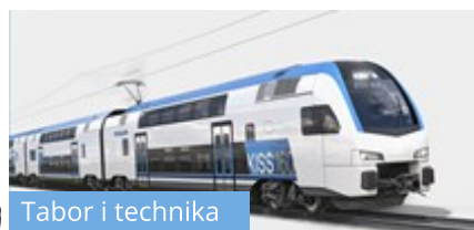
Tabor i technika

Stadler Polska zbuduje piętrowe pociągi dla Bułgarii