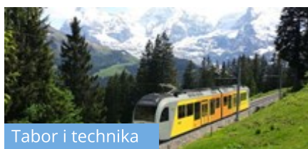
Tabor i technika