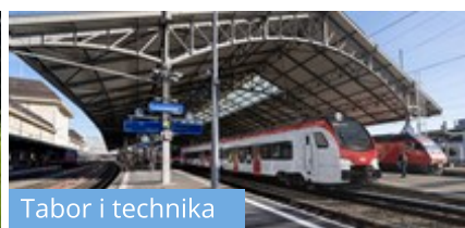
Tabor i technika

Flirty Stadlera ułatwią przejazd ze Szwajcarii do Francji