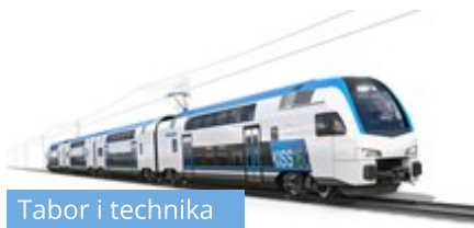
Tabor i technika

Stadler Polska zbuduje dla bułgarskich kolei piętrowe Kissy