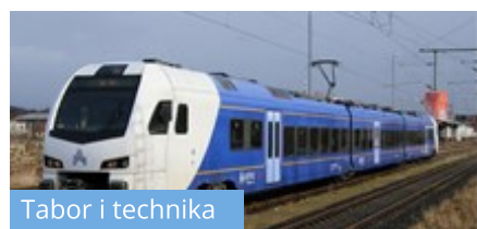
Tabor i technika