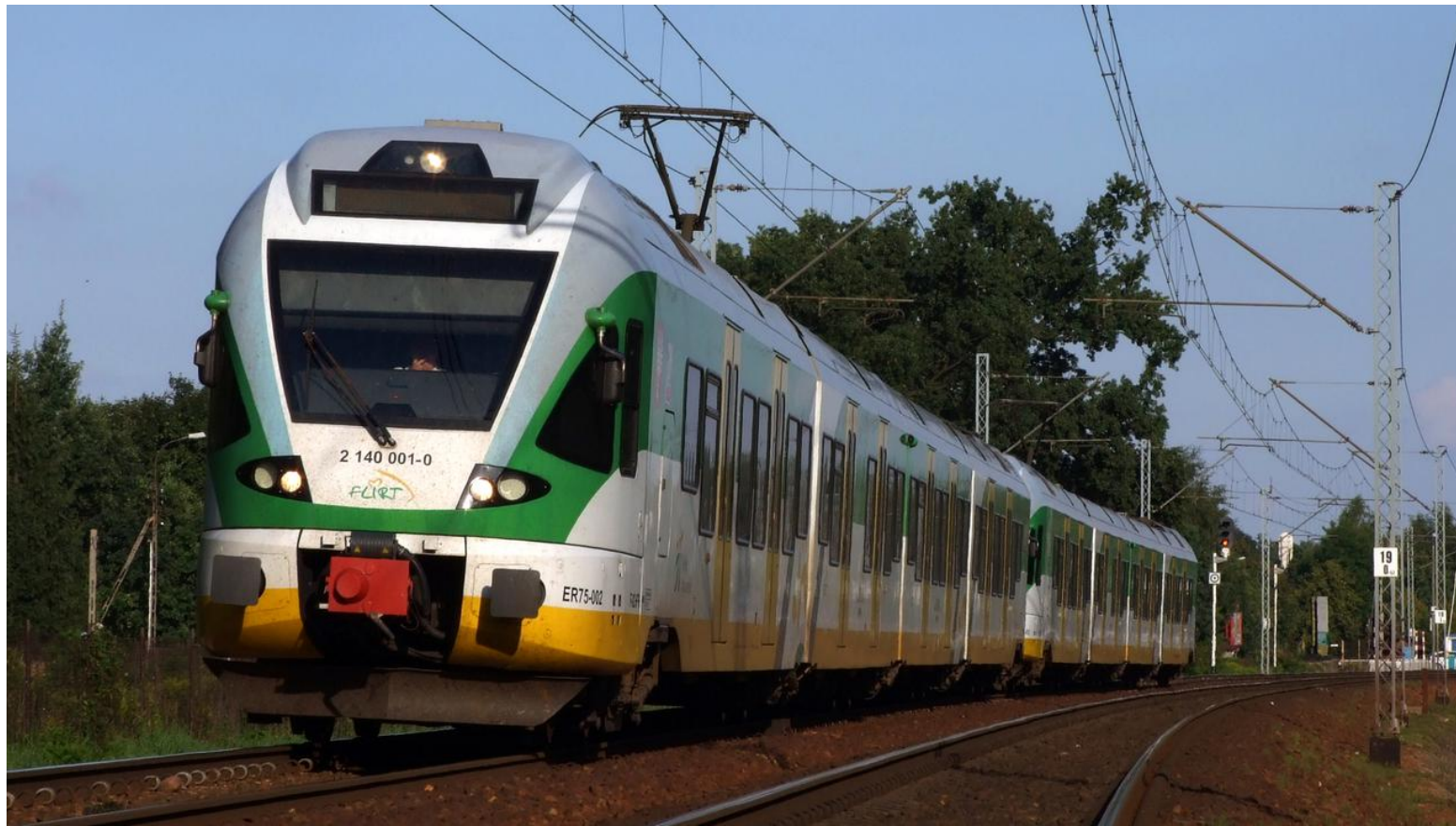
Pociąg Kolei Mazowieckich (zdjęcie ilustracyjne)

Najnowsze 28 września 2022, 17:40 Autor: dg Źródło: twnwarszawa.pl